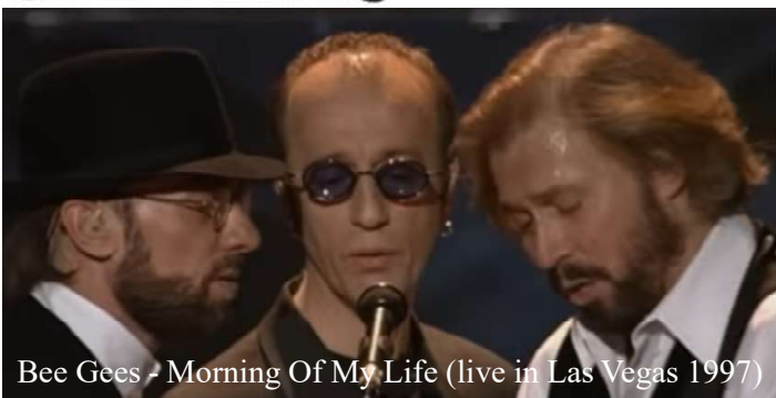
Bee Gees - Morning Of My Life (live in Las Vegas 1997)