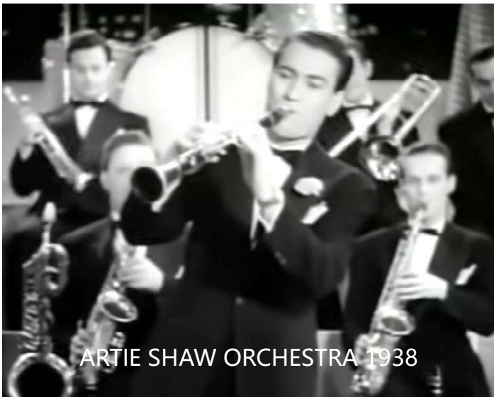
ARTIE SHAW ORCHESTRA 1938

Prvi komercijalni snimak je od Orkestra Xavier Cugat, snimljeno je 15. septembra 1935., a Victor je objavio u oktobru 1935. godine. Ostali rani snimki su od Joe Haymes (1935) i Pierre Allier (1938). Svoju ogromnu popularnost duguje ta pesma snimku Artie-a Shaw-a i njegovog orkestra, snimljeno za Bluebird 24tog jula 1938e i objavljenom u augustu 1938. Pesa je bila na prvom mestu u SAD-Billboard top listi ukupno 6 nedelja. Do 1944e je taj singl prodat u jedan milion primeraka - za ono doba jedan neverovatan uspeh! Nakon Arti-a-Shaw-a su i mnogi drugi istaknuti orkestri napravili svoje verzije kao Harry James, Tommy Dorsey, Benny Goodman, Glenn Miller i Ray Conniff, ali i pevači poput Franka Sinatre ( 1938) i mnogih drugih.